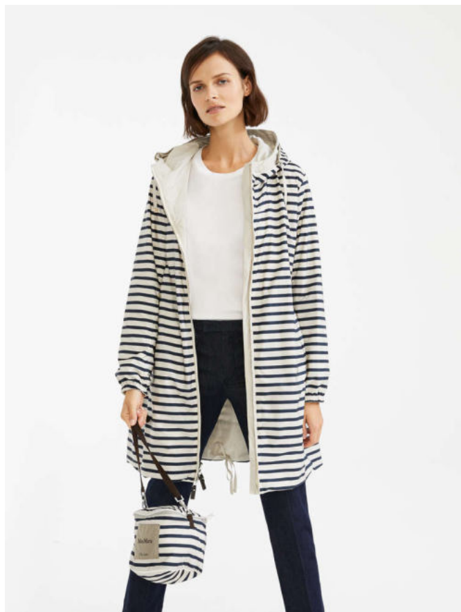
Двусторонняя парка из водоотталкивающей тафты