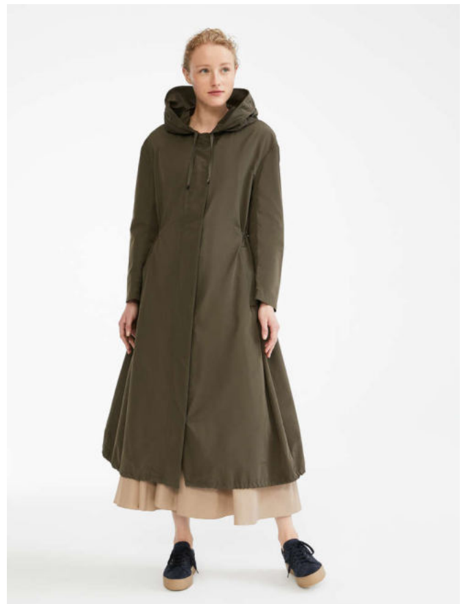
Парка из водоотталкивающей хлопковой ткани