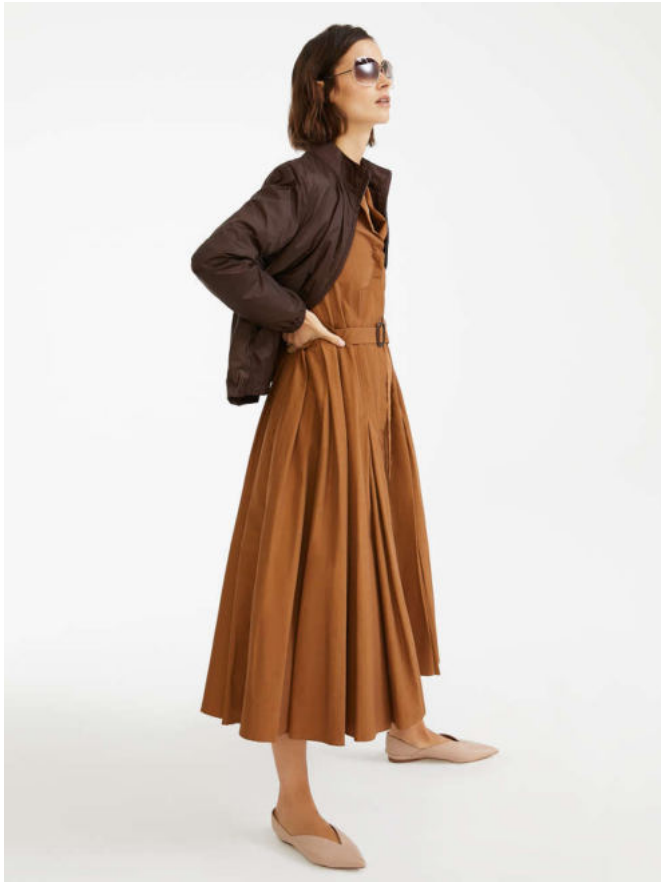
Куртка из водоотталкивающей тафты