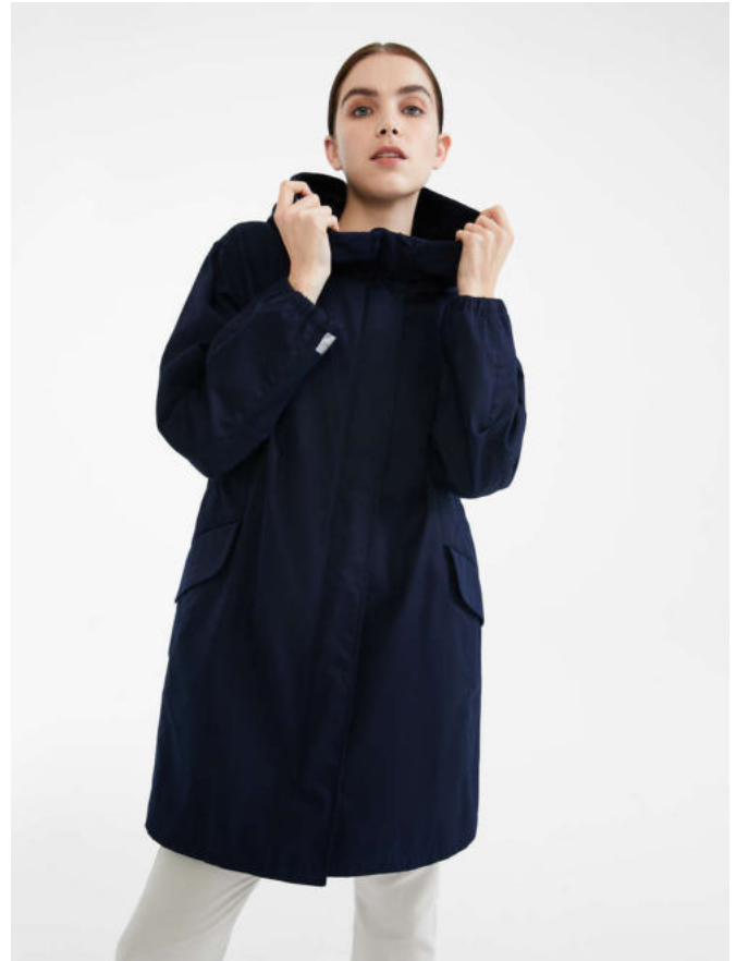
Парка из водоотталкивающей хлопковой ткани панама