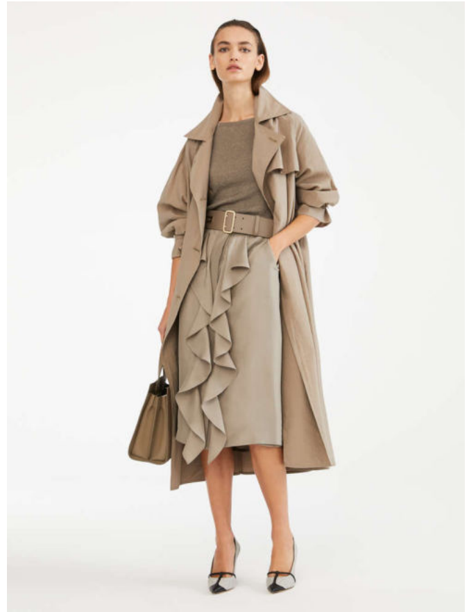
Trench coat in cotton-blend fabric