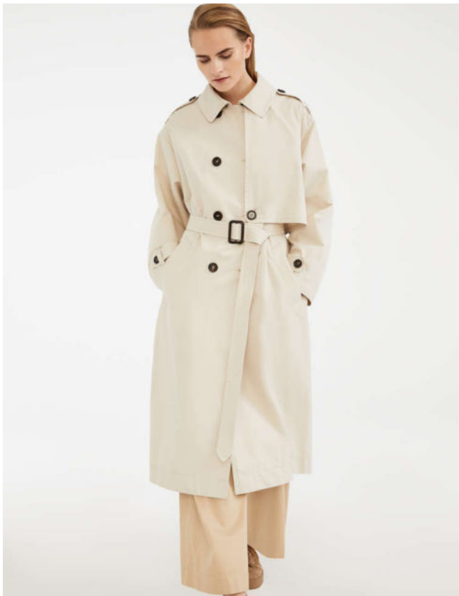
Тренч из хлопкового габардина