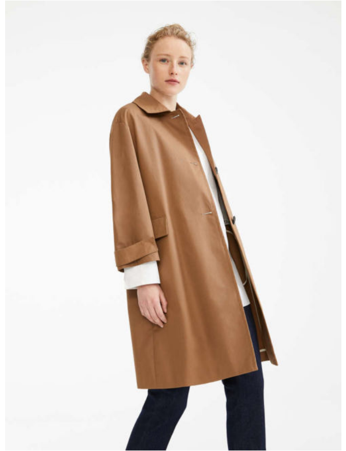
Тренч из водоотталкивающей ткани панама