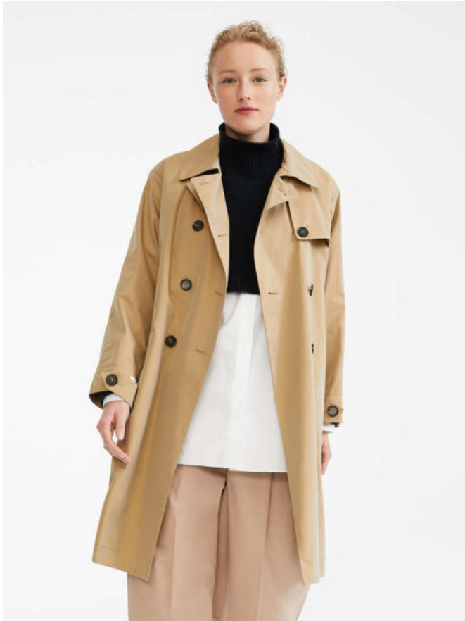
Тренч из хлопкового габардина