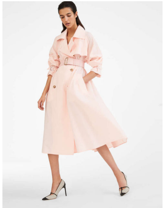
Trench coat in cotton-blend fabric