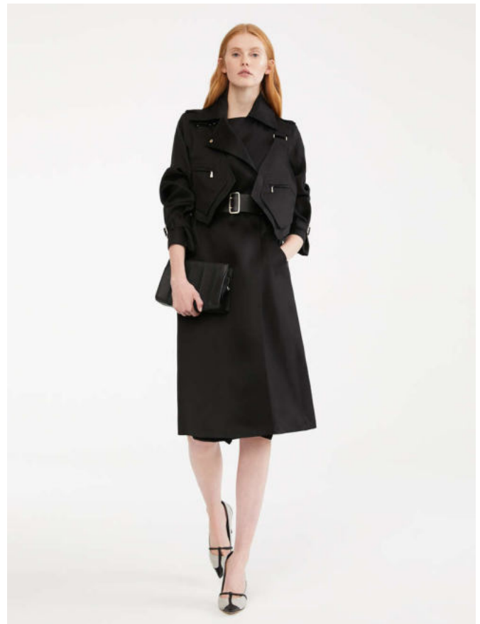
Silk gauze trench coat