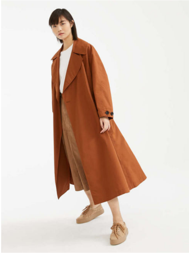
Тренч из водоотталкивающей смесовой ткани из хлопка и шелка