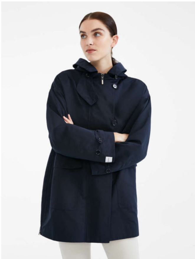
Парка из водоотталкивающей ткани фэй