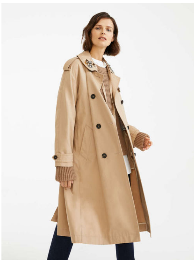
Тренч из водоотталкивающей ткани панама